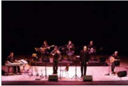
Orquestra Àrab de Barcelona, la otra orquestra de Barcelona. Agost del 2007